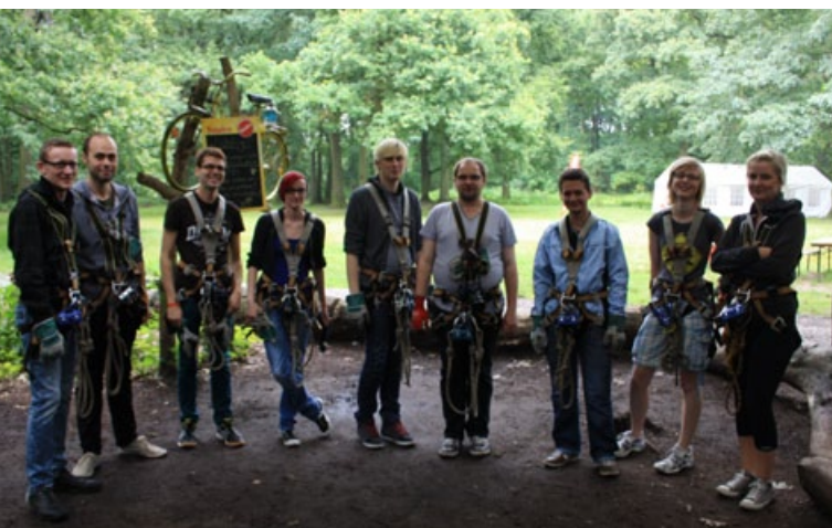
Klettern im Hochseilgarten

Gleichzeitig verschlechterten sich seit den 90er Jahren die finanziellen Spielräume der Kommunen. Während im Feld der Jugendarbeit oft sogar empfindliche Kürzungen erfolgten, gelang es nur in wenigen Kommunen, neue Angebote speziell für junge Lesben und Schwule erfolgreich zu initiieren. Die wenigen Angebote entstanden - getragen von viel ehrenamtlichem Engagement - ausschließlich in Großstädten und Ballungszentren. Hier werden sie von vielen jungen Lesben, Schwulen und Bisexuellen aber auch Trans*Jugendlichen genutzt, um (neue) Freund_innen zu finden und zu treffen sowie sich frei von Ausgrenzung gemeinsam mit relevanten Themen zu beschäftigen. Sie