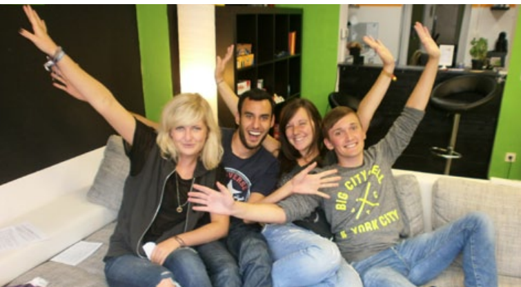
Ehrenamtliche together niederrhein

Das Bundesland Nordrhein Westfalen (NRW) hat die Aufgabe, sich um vergleichbare Lebensbedingungen in ganz NRW zu bemühen und in der (kommunalen) Jugendarbeit Impulse zur Weiterentwicklung zu setzen. Dies erfolgt in NRW unter anderem über den Kinder- und Jugendförderplan des Landes.