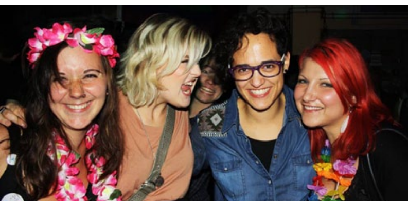
Party Ready Steady Go

Auch im ländlichen Raum lassen sich – trotz diverser Schwierigkeiten – regional erfolgreiche Angebote umsetzen.