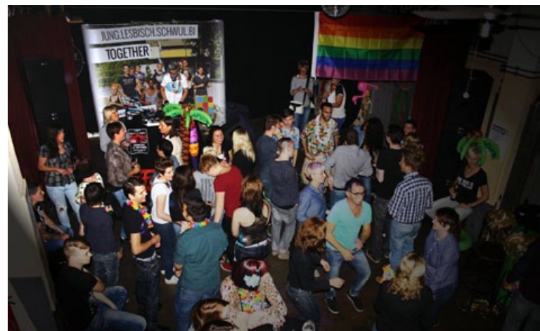
Party Ready Steady Go

Hilfe beim Coming-Out, wie noch in den 90er Jahren durch sogenannte Coming-Out-Gruppen geleistet, wird von jungen Lesben und Schwulen nur noch selten explizit angefragt. Zahlreiche Schwierigkeiten werden allerdings im Kontakt mit den jungen Menschen sichtbar. Durch die vermeintlich positiven, gesamtgesellschaftlichen Veränderungen in der Akzep-