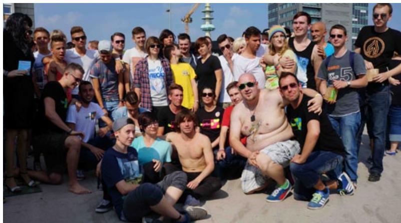
SLaM Moers und together niederrhein: Gemeinsamer Aktion CSD 2014

Mit den bestehenden Projekten SLaM Moers und MGay Mönchengladbach wurde ein intensiver Austausch gepflegt. Mit beiden Gruppen wurden Möglichkeiten der Weiterentwicklung und intensiveren Vernetzung besprochen. Diese Gespräche führten u.a. zur Gründung/Übergabe des neu gegründeten Projektes „SchLAu Mönchengladbach“ an die Gruppe MGay bei der AIDS-Hilfe Mönchengladbach oder auch zu gemeinsamen Gesprächen mit den örtlichen Jugendämtern in und um Moers (SLaM Moers) – zur Präsentation der Arbeit und Einwerbung von struktureller Unterstützung in 2014.