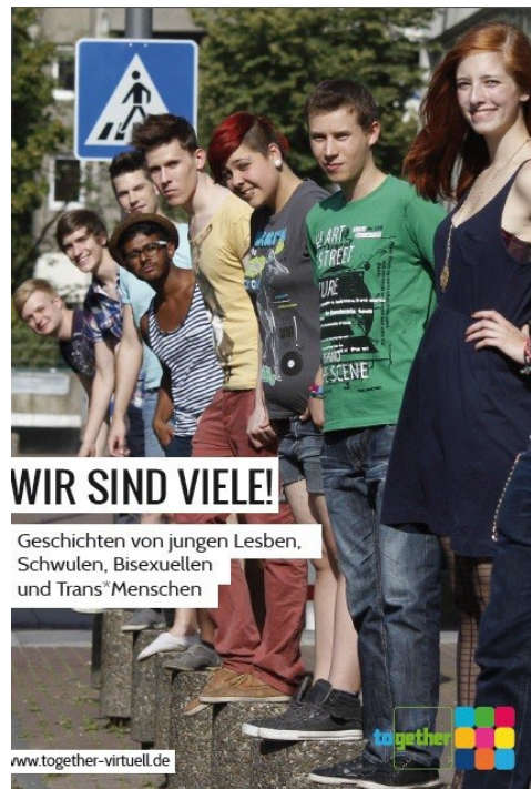
Informationsbroschüre: Wir sind Viele!

„Im together habe ich viele neue Menschen kennengelernt, Freundschaften geknüpft und Anschluss gefunden. Wir machen tolle und ungewöhnliche Aktivitäten, erleben viel, oder hängen auch einfach nur rum.“ (Mona 24)