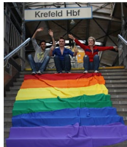
Internationaler Tag gegen Homo- und Transphobie Krefeld

Regelmäßige Angebote sind eine wichtige, strukturgebende Basis für die schwul-lesbische Jugendarbeit. Unregelmäßige Einzelangebote (Fahrten/Projekte) sind jedoch besonders beliebt. Sie bieten Abwechslung und halten die LSB-Jugendarbeit interessant. Vor allem am Anfang sind geschlechterspezifische Angebote beliebter. Die Wünsche und Themen von Jungen und Mädchen können dabei sehr unterschiedlich sein – gerade bei der Herausbildung von einer selbstbewussten geschlechtlichen und sexuellen Identität.