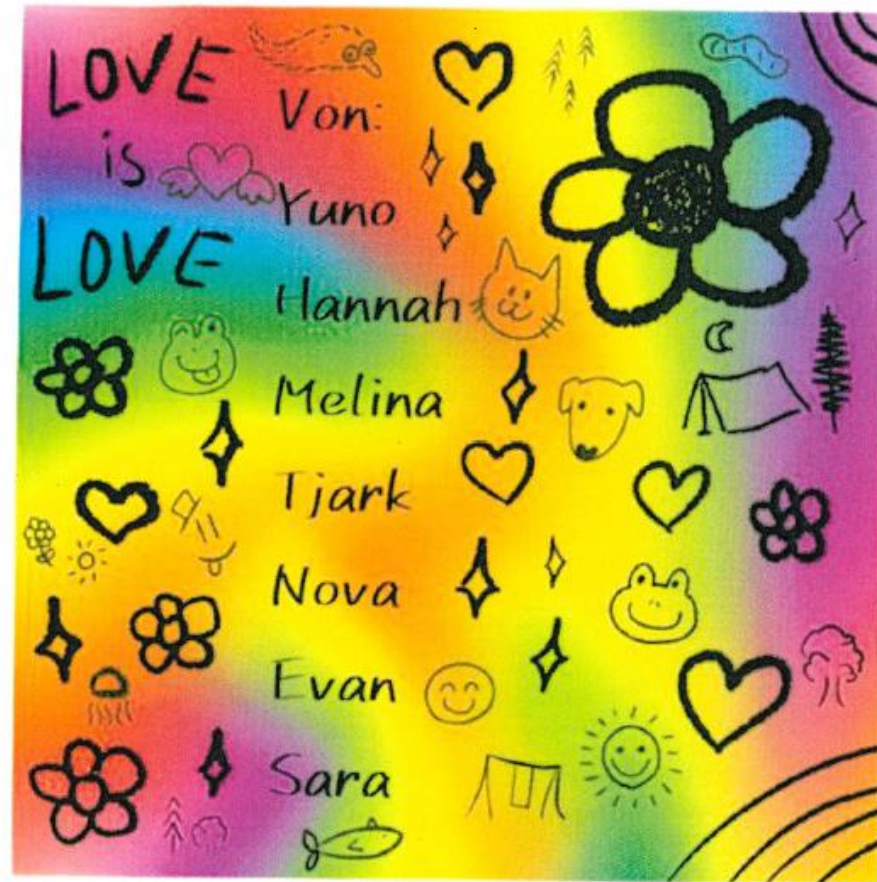
Projekt vom Queer Treff Neheim